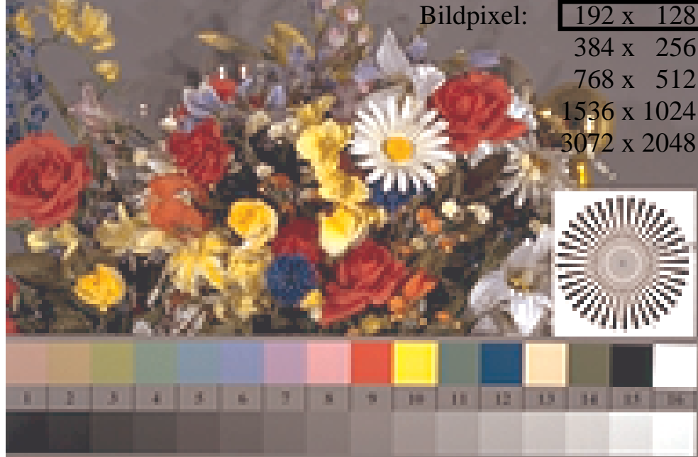
Bild B1: Blumenmotiv, 14 CIE-Prüfbarben sowie 2 + 16 Graustufen (sf); PS-Operatoren settransfer , 4 colorimage

Bildpixel: 192 x 128 384 x 256 768 x 512 1536 x 1024 3072 x 2048