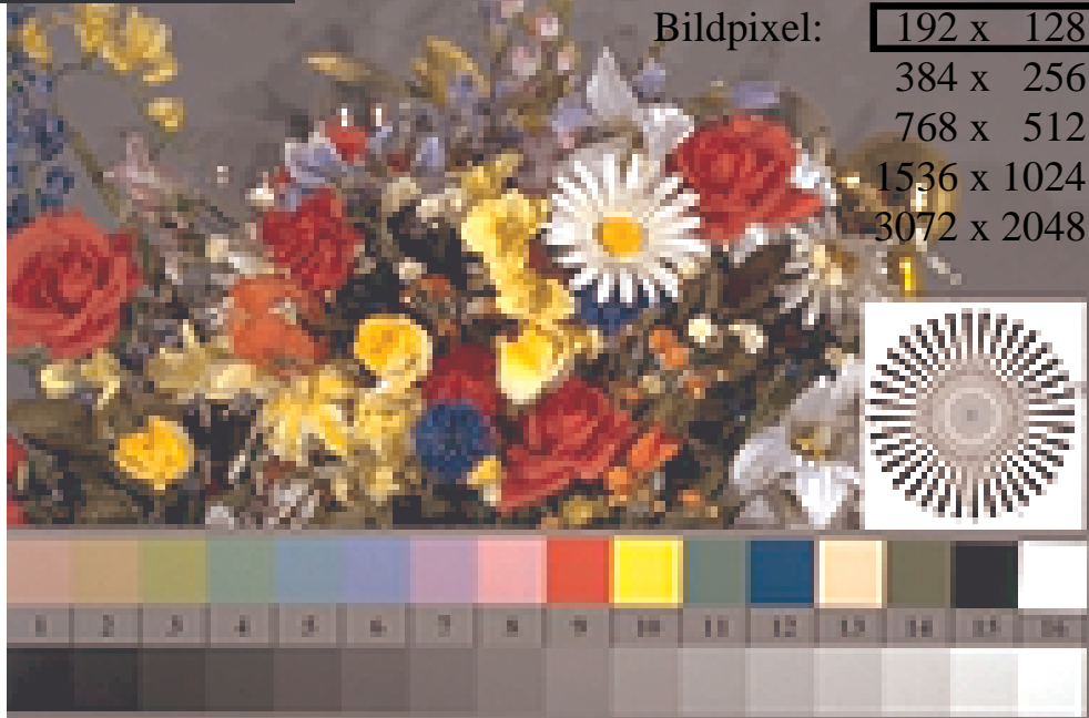
Bild B1: Blumenmotiv, 14 CIE-Prüffarben sowie 2 + 16 Graustufen (sf); PS-Operatoren settransfer , 4 colorimage

Bildpixel: 192 x 128 384 x 256 768 x 512 1536 x 1024 3072 x 2048