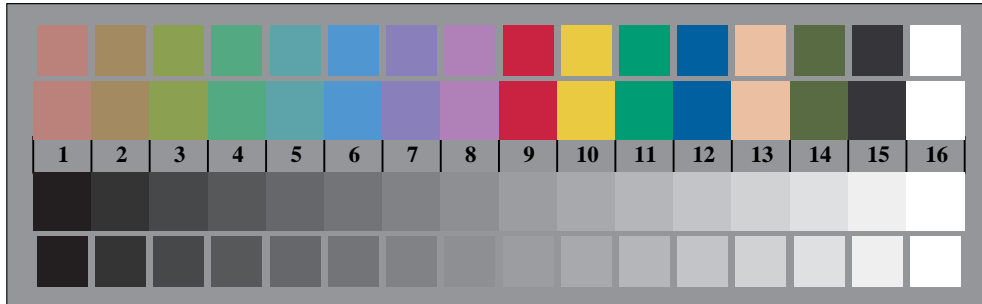
Bild B3: 14 CIE-Prüffarben sowie 2 + 16 Graustufen; PS-operator cmY0*/000n* setcmYcolor

Fig. B1 bis B7; ISO/IEC-Prüfvorlage 2; ISO/IEC 15775 und input: cmY0*/000n* setcmYcolor DIS ISO/IEC 19839-X; output: Startup (S) data dependend