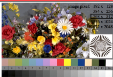
AGE20-1N, Picture 01: Flower motif, 16 CIE test colours and 16 grey steps (d), PI operators \text{rgb} \rightarrow \text{rgb}_{\text{L}} , \text{L} \rightarrow \text{rgb}_{\text{L}}