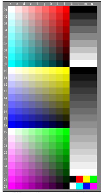
AS590-71 Parte del gráfico de prueba AS59 con 1080 colores; escalas de colores de 9 o 16 pasos; los datos en la columna (b-n): rgb 3-100110-L0 cmy6*

Discriminability de los colores cromáticos Comentarios: Esta prueba utiliza los colores cromáticos de 9 pasos Tono plano Rojo - Azul cyan (filas 01 a 09, columna de la b a la j) Discriminability de 81 colores cromáticos ¿Son todos los 81 colores diferentes? Si/No Solo en casa de "No": ¿Cuántos son diferentes? De los 81 hay different ..... Tono plano Amarillo - Azul (filas 10 a 18, columna de la b a la j) Discriminability de 81 colores cromáticos ¿Son todos los 81 colores diferentes? Si/No Solo en casa de "No": ¿Cuántos son diferentes? De los 81 hay different ..... Tono plano Verde - Rojo magenta (filas 19 a 27, columna de la b a la j) Discriminability de 81 colores cromáticos ¿Son todos los 81 colores diferentes? Si/No Solo en casa de "No": ¿Cuántos son diferentes? De los 81 hay different ..... Resultado: De los 243 (=3x81) colores hay different ..... Los artefactos, por favor especifique si está visible: ..... Comentarios acerca de la creación y el contenido de los archivos PDF: A veces "Suavizado de colores" es una configuración predeterminada. En esta caso los 9 pasos a menudo no son visibles y pueden ser contados como un paso. A veces "la optimización de PDF para la web" es una configuración predeterminada. Por ejemplo, esta opción puede reducir el 1080 colores en una página de 256 colores.