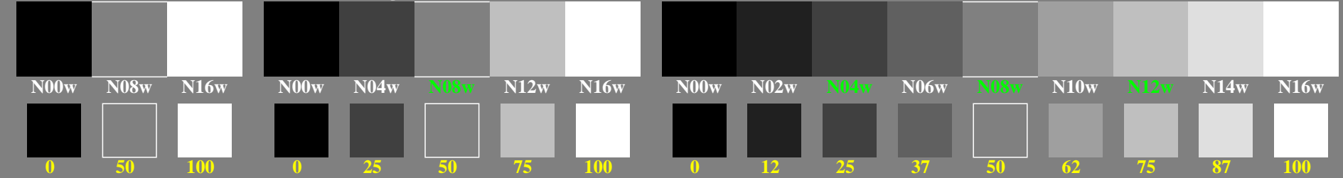
ggp20-1n, Prüfmuster: 3, 5 und 9 Farbstufen, greu=0,500, expu=1,000, expa=1,000

0, 125, 250, 375, 500, 625, 750, 875, 1000 Schwarz N00w – Schwarz N16w = Weiß W L^*_{TUBLOG,U} = 50 \log(Y / 5Y_U) + 50, Y_N=4, Y_U=20, Y_W=100