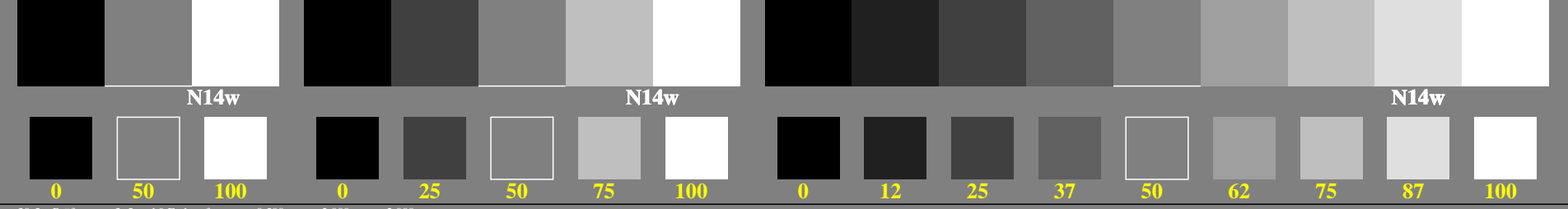
ggq30-5n, Prüfmuster: 3, 5 und 9 Farbstufen, greu=0,500, expu=2,000, expa=2,000

Drei, 5 und 9 Farbstufen für visuelle Beurteilung L^*_{TUBLOG,U} = 50 \log(Y / 5Y_U) + 50, Y_N=4, Y_U=20, Y_W=100 0, 15, 62, 140, 250, 390, 562, 765, 1000 Schwarz N00w – Schwarz N16w = Weiß W