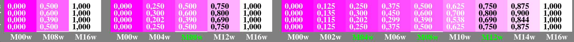
hgm20-7n, Prüfmuster: 3, 5 und 9 Farbstufen, greu=0,500, expu=1,000, expa=1,000, expi=1,000

Drei, 5 und 9 Farbstufen, erzeugte visuelle Linearisierung i: 0, 115, 202, 299, 390, 538, 690, 844, 1000 I^*_{TUBLOG,U} = [50/\log(5)] \log(Y/Y_U) + 50, Y_N=4, Y_U=20, Y_W=100 Magenta M00w – Magenta M16w = Weiß W