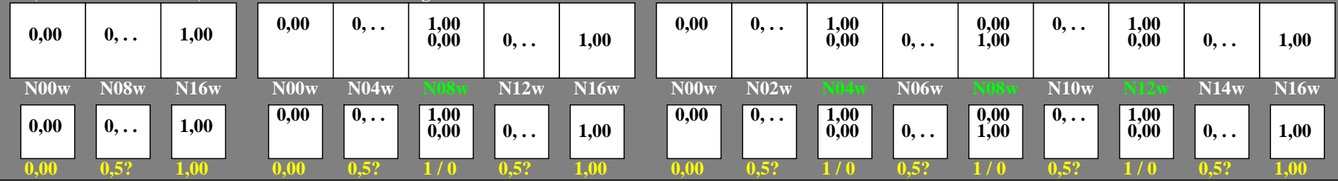
hgz10-3n, Prüfmuster: 3, 5 und 9 Farbstufen, greu=0,500, expu=1,000, expa=1,000

0, 125, 250, 375, 500, 625, 750, 875, 1000 Schwarz N00w – Schwarz N16w = Weiß W L^*_{TUBLOG,U}=[50/\log(5)] \log(Y/Y_U)+50, Y_N=4, Y_U=20, Y_W=100