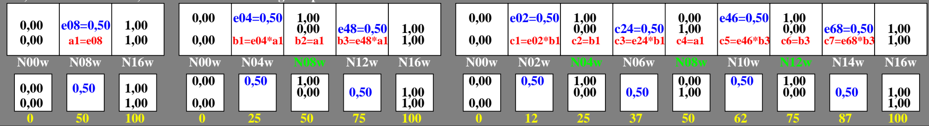
hgz10-5n, Prüfmuster: 3, 5 und 9 Farbstufen, greu=0,500, expu=1,000, expa=1,000

0, 125, 250, 375, 500, 625, 750, 875, 1000 Schwarz N00w – Schwarz N16w = Weiß W L^*_{TUBLOG,U}=[50/\log(5)] \log(Y/Y_U)+50, Y_N=4, Y_U=20, Y_W=100